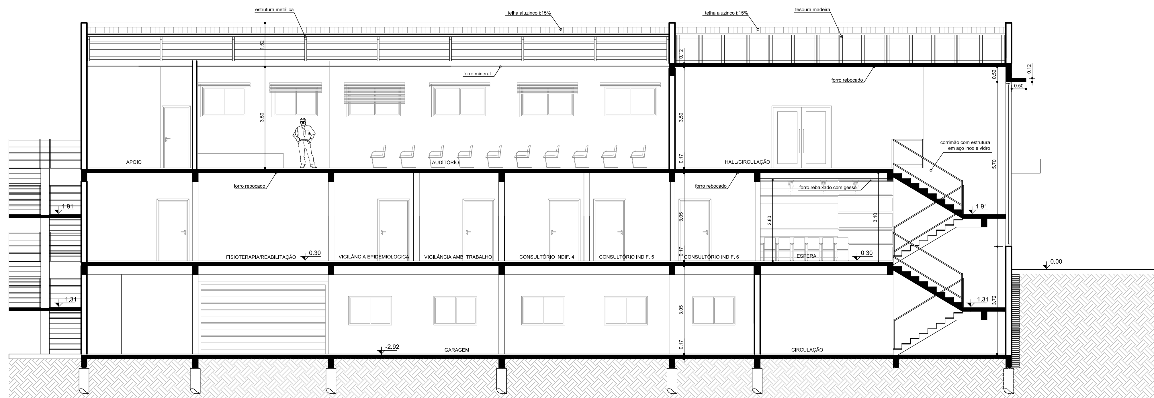
CORTE CC ESC. 1/75