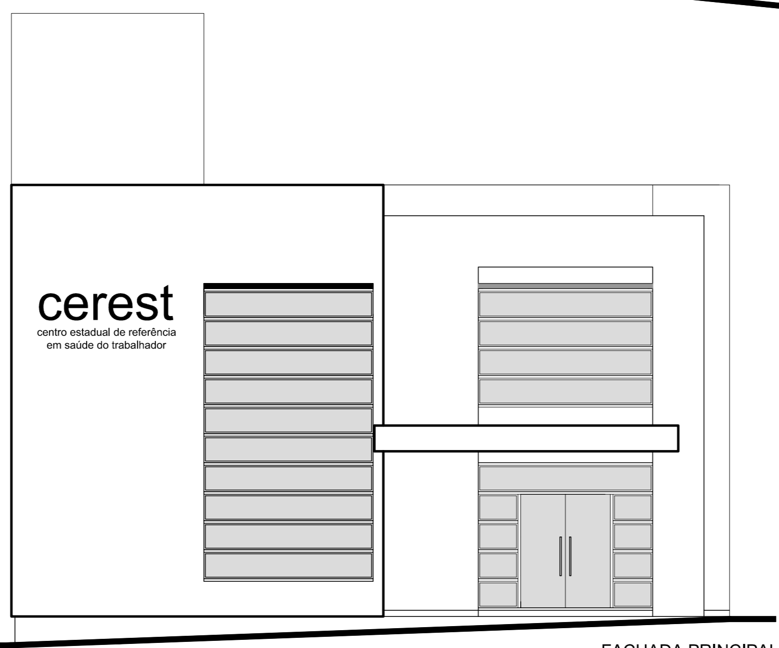
FACHADA PRINCIPAL ESC. 1/15